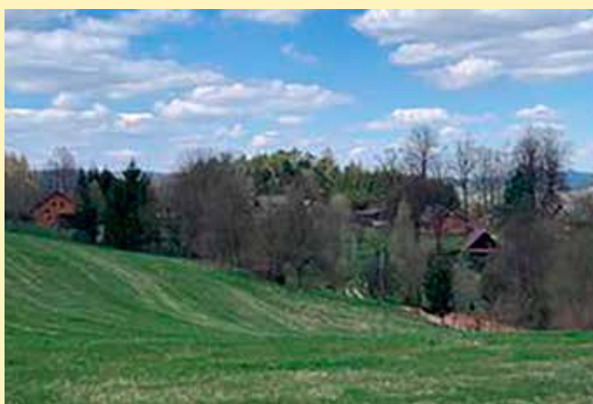
Jaro na Kočtině

Hlavně buďte hodně zdraví a za celou redakci DN vám přeji krásné jaro. Dita Hasíková