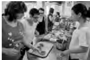
Praktický seminář na téma Luštěníiny