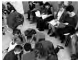
Ukázková hodina na téma Spolupráce učitele a asistenta pedagoga