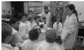
Pilotáž - Noc vědců v podání DDM Kamarád Česká Třebová

Veškeré informace najdete na www.maporlicko.cz . Zde je k dispozici i KVARTETO ze školního prostředí, které jsme zpracovali a které si můžete zdarma stáhnout a zahrát.