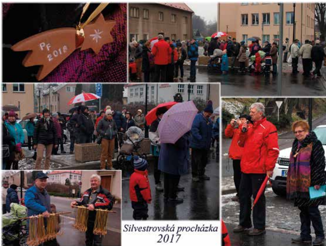
Silvestrovská procházka 2017