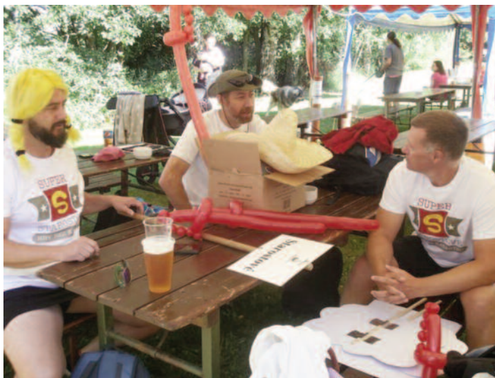
starostové v okamžiku soustředění

Družstvo z Dolní Dobrouče, tvořené v podstatě členy šermířské skupiny Lucrezia, se jako jediné zúčastnilo všech 61 ročníků her, při čemž zvítězilo v 61 disciplínách ze zmíněných 462, čtrnáctkrát se stalo celkovým vítězem Her a Hry sedmkrát pořádalo. Naposledy se tak stalo 12. srpna letošního roku na šejvském hřišti (GPS 50°0'35.80"N, 16°28'28.70"E) za účasti 15 družstev, která soutěžila ve skutečně netradičních disciplínách (ty mají vždycky úmyslně matoucí názvy): 1. Dobroučské krátké strážné aneb na vodné a stočné raději nehleďte; 2. Seno, sláma, Eldorado aneb letní lyžovačka s bílou holí; 3. Zafúkané, nafúkané v kelímku aneb když se načančám, ten svetr si (mi) nesvlíkej;