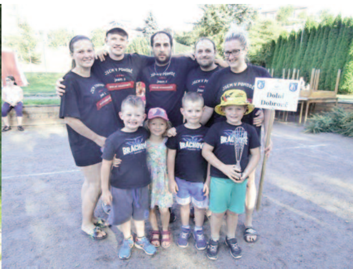
družstvo Dolní Dobrouče vybojovalo skvělé 2. místo

telům a podporovatelům z Dolní Dobrouče za krásné chvíle.