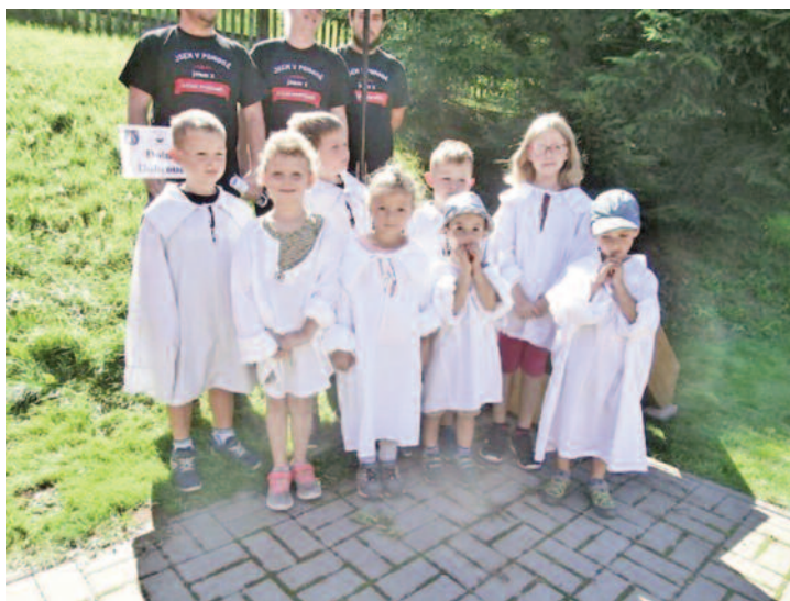
zpívající andělci - mušketýrský potěr