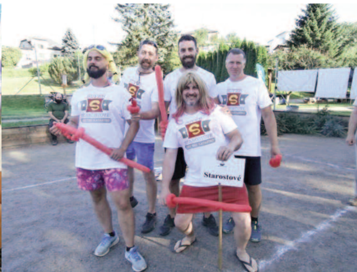
starostové při vyhlášení výsledků

zastavit, zapomenout na všední ruch a shon, umí si sami ze sebe udělat legraci, no zkrátka hrát si jako malí.