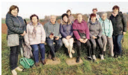
pochod proti diabetu

6. 9. 2022 jsme zorganizovali pro naše „seniory“ celodenní výlet do Hlinska – prohlídka Betléma, Veselého kopce zakončena večerí ve Sportotelu Ústí nad Orlicí.