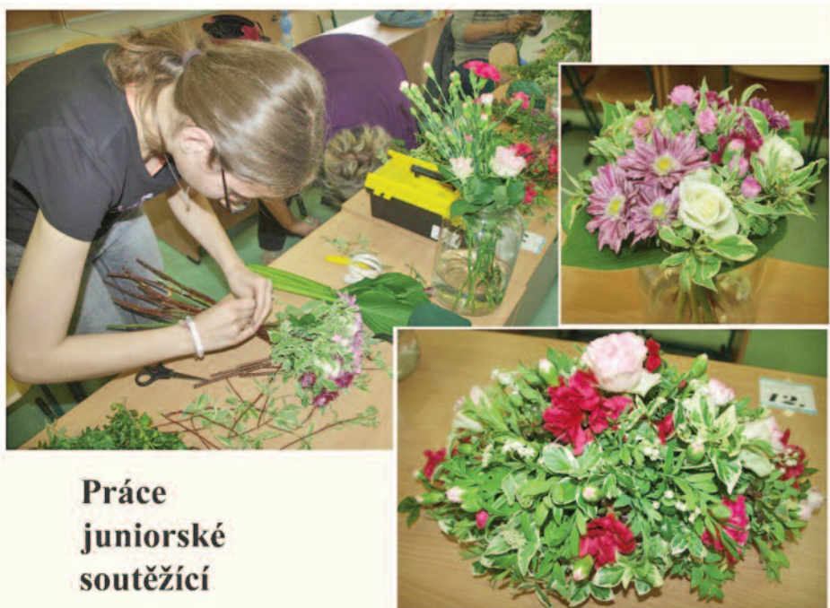
Práce juniorské soutěžící

ZO ČZS Dolní Dobrouč byla pověřena organizací okresního kola floristické soutěže. Ve spolupráci se základní školou byla tato soutěž připravena na 24. května 2023.